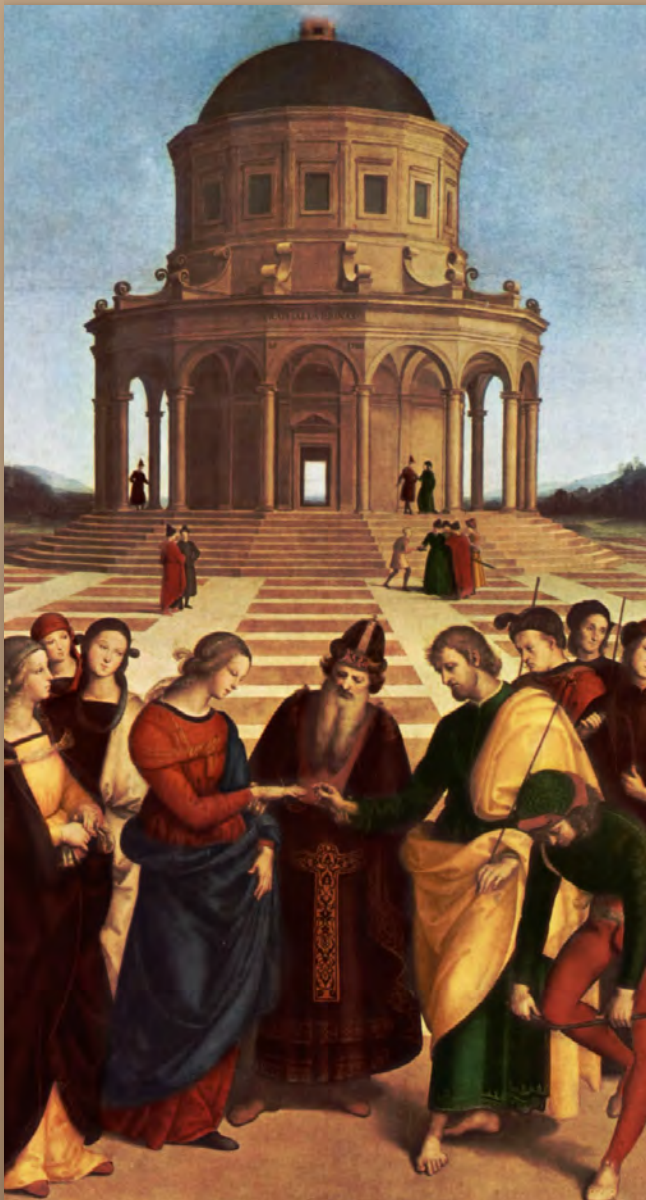
Los desposorios de la Virgen

Maestro del clasicismo, Rafael aunó precisión de dibujo, armonía de líneas y delicadeza de colorido con una amplitud especial y expresiva totalmente nueva. Su inspiración, su habilidad, su talento y su oficio constituyen un modelo y un dechado de perfecciones y le erigen estatua inmortal para ejemplo y enseñanza de la posteridad. Cuando más contemplamos sus cuadros mayor es la admiración que sentimos por lo qué y cómo lo pintó. Con él la luz se hizo más luz. Aire y donaire siguen cruzando por su obra donde siempre es primera.