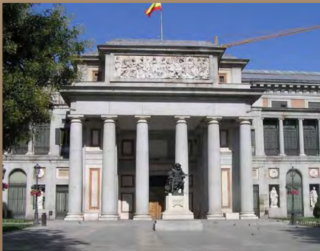
Museo del Prado

E l Museo del Prado ha presentado recientemente la exposición “El último Rafael”, una de las muestras más importantes dedicadas al artista y a su taller, y la primera centrada en sus años finales, etapa de su producción que le convirtió en el pintor más influyente del arte occidental. Fue coorganizada con el Museo del Louvre y patrocinada por la Fundación AXA y obtuvo un gran éxito de prensa y público. “El último Rafael” ha sido, hasta ahora, la primera gran expresión monográfica de Rafael (Raffaello Sanzio, 1483-1520) que combinó pinturas y dibujos centrándose en los últimos siete años de su corta existencia, el período de su carrera que alcanzaría las más altas cimas. Empero, estas postreras pinturas no han sido bien comprendidas, en parte porque presentan problemas de cronología, en parte porque su diversidad desconcierta, y en parte también porque no creaba solo. Las tres últimas exposiciones sobre Rafael, celebradas en Londres, Roma y Urbino, se centraron en su juventud y el único intento que se ha hecho sobre su época final fue a través de la exposición celebrada en Mantua y Viena en 1999, pero se trató de una exposición fundamentalmente de dibujos.