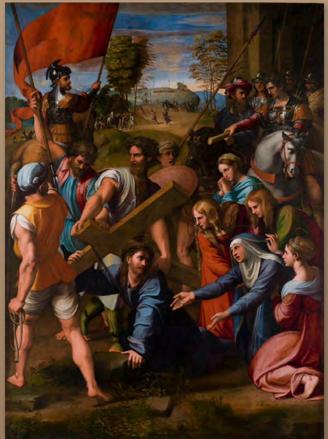
Caída en el camino del Calvario