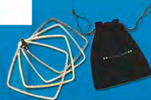
Toalla absorbente microfibra