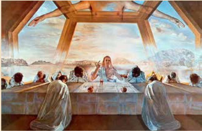
La última cena

Dalí produjo alrededor de 1.500 pinturas a lo largo de su carrera, además de docenas de ilustraciones para libros, litografías, diseños escenográficos, vestuarios y una ingente cantidad de dibujos, esculturas y proyectos paralelos en fotografía y cine.