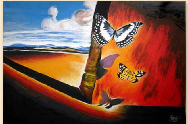
Paisaje con mariposas

Termino. Salvador Dalí no sólo destaca como gran pintor y uno de los mejores dibujantes de todos los tiempos. Dalí fue, antes que nada, un personaje. Desde muy joven se propuso triunfar, ser célebre, llamar la atención... ¡y vaya si lo consiguió! Mucha gente le admiró, pero muy pocos le quisieron de verdad. Acaso por su irrefrenable narcisismo. Dedicó su enorme talento tanto a la pintura como a la propaganda de su imagen pública.