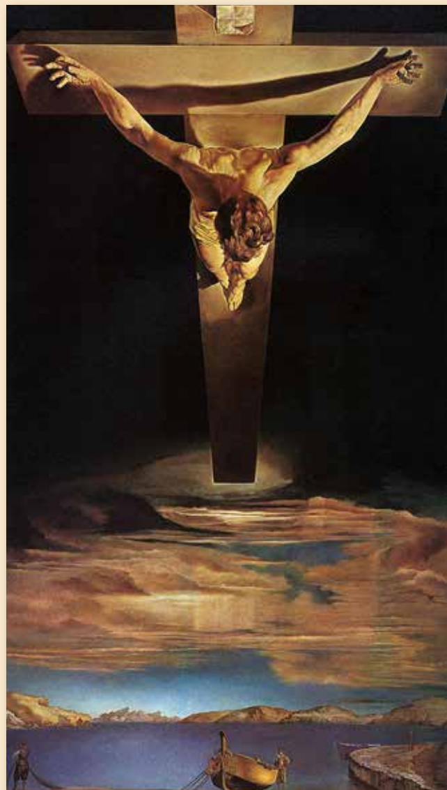
Cristo de San Juan de la Cruz

Esta muestra nos ofreció la posibilidad de analizar la obra artística de Dalí y los diferentes lenguajes utilizados. A través de todo el material exhibido (pinturas, esculturas, dibujos...) que se plasmó en un discurso concebido en once secciones con el hilo cronológico como conductor, la exposición