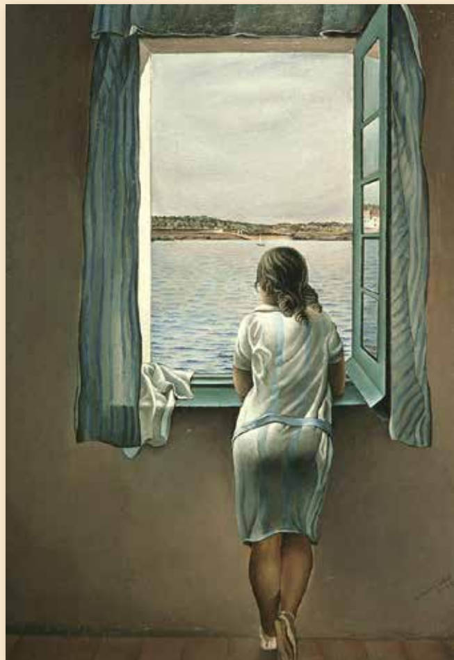
Muchacha en la ventana

Nació en Figueras en 1904 en el seno de una familia acomodada. Su padre era abogado y notario